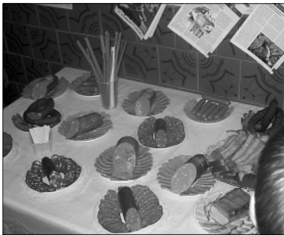
А дегустация салмановских колбас и копченостей привела ребят в восторг!

Ректорат Ульяновской государственной сельскохозяйственной академии, деканат биотехнологического факультета и сотрудники кафедры частной зоотехнии и технологии животноводства выражают искреннее соболезнование родным и близким покойного.