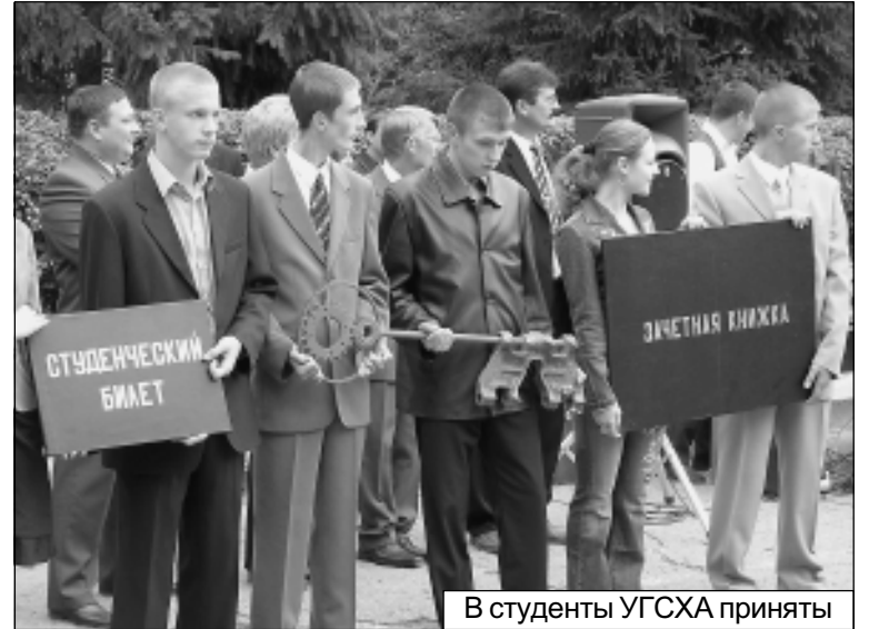
В студенты УГСХА приняты