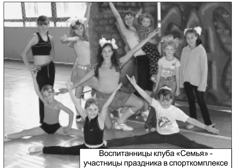
Воспитанницы клуба «Семья» - участницы праздника в спорткомплексе