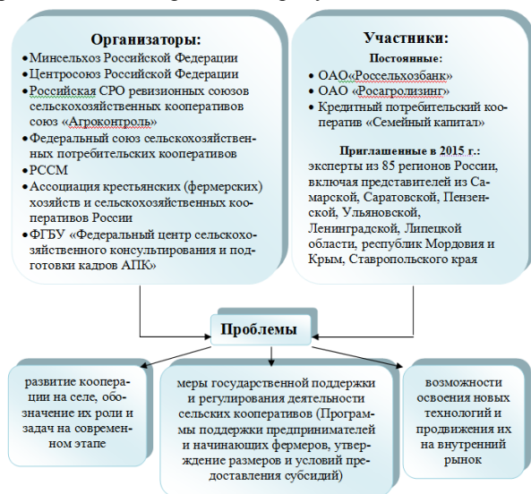
Рис. 1 – Схема проведения III Всероссийского съезда сельских кооперативов в 2015 г.

25–26 августа 2015 г. в рамках международной выставки «Агрорусь-2015» в выставочном комплексе «Ленэкспо» г. Санкт-Петербург прошел III Всероссийский съезд сельских кооперативов, схема организации которого наглядно отражена на рисунке 1.