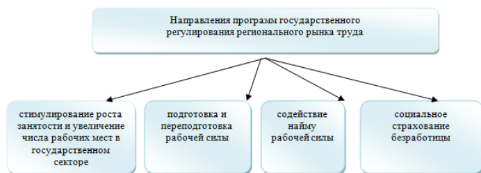
Рис. 1 – Регулирование регионального рынка труда

Как известно, рынок труда нуждается в квалифицированном регулировании. Одна из основных социальных задач реформ, проводимых в России, – создание действенной системы регулирования в сфере занятости. Большую роль в обеспечении занятости имеет государство. Выделим основные направления программ государственного регулирования регионального рынка труда (рис. 1).