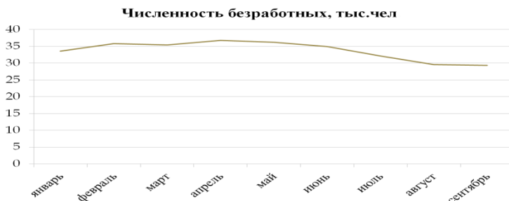
Рис. 2 – Численность безработных Ульяновской области в 2015 г.

Вследствие этого меняются приоритеты и у государственной службы занятости региона. На первый план выходит уже не борьба с безработицей, а эффективное развитие регионального рынка труда, максимальное вовлечение граждан в трудовую деятельность, усиление работы, направленной на раннюю профессиональную ориентацию подрастающего поколения, использование потенциала центров занятости населения в плане развития трудовой мобильности, качественное управление региональным рынком образовательных услуг, с учетом потребности рынка труда, применение передовых технологий рекрутинга для эффективного кадрового сопровождения инвестиционных проектов.