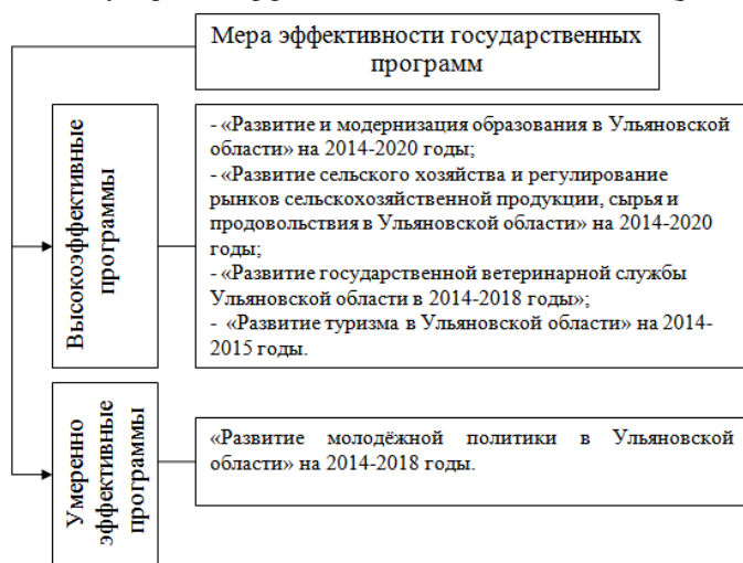
Рис. 1 – Мера эффективности государственных программ

Так, в Ульяновской области высокоэффективными признаются пять программ, а к умеренно эффективной отнесена лишь одна (рис. 1).