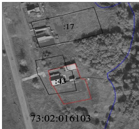
Рисунок 1 - Схема расположения земельных участков