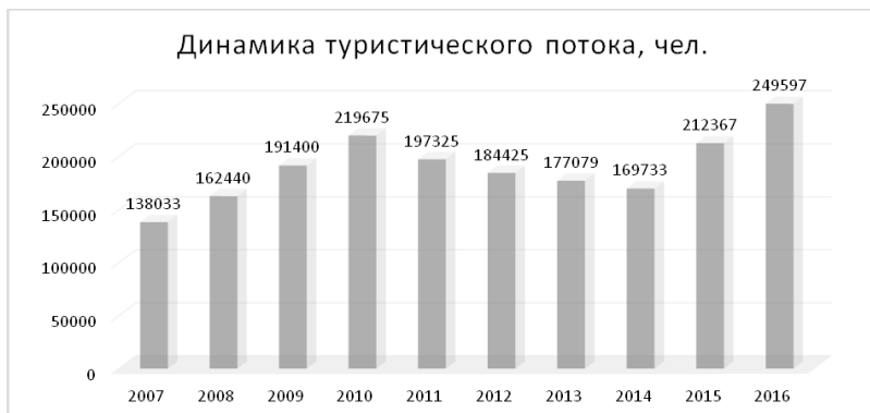
Рисунок 1 – Динамика туристического потока в Слюдянском районе

ки, пригодные для размещения стационарных и сезонных баз отдыха. Число туристов, стремящихся на Байкал, с каждым годом растет [4].