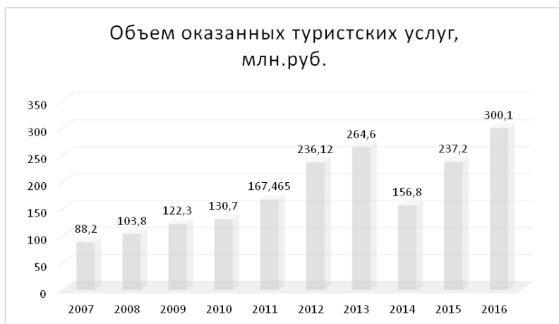
Рисунок 3 – Динамика объема оказанных туристических услуг, млн. рублей

ный курорт составило 127852 чел. Среди прибывших туристов в 2016 году 638 человек являются иностранными туристами, преимущественно из Китая (590 чел.), что в 18,7 раза больше показателя 2015 года [5].