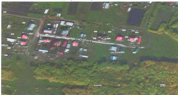
АЭРОФОТОСНИМОК территории п.Новоселки, ул.Зеленая Мелекесского района Ульяновской области Кадастровый квартал 73:08:043902