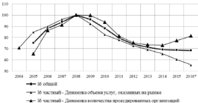
Рисунок 1– Частные и общий базисные индексы деловой активности на рынке аудиторских услуг, %