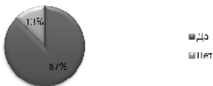
Рисунок 2 – Ответы преподавателей про изменения- методов обучения

ории и практики. Современные методы преподавания являются многоаспектным, сложным педагогическим явлением. Под ними принято подразумевать варианты достижения поставленной цели, совокупность операций и приемов теоретического либо практического освоения действительности, решение конкретных задач в зависимости от преподаваемой учебной дисциплины.