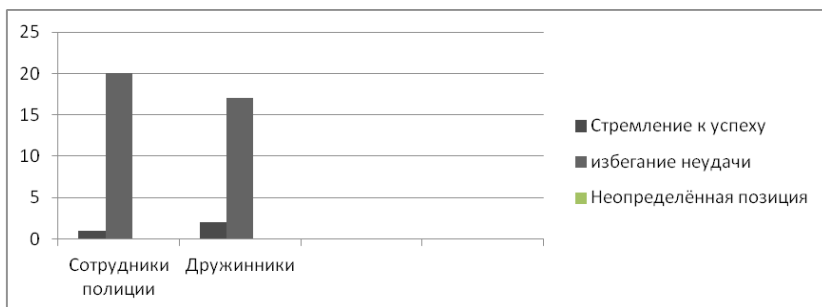
Диаграмма №1. Сопоставление результатов по методике «Тест диагностика мотивации достижения А. Мехрабиан»

Таким образом, можно отметить, что у сотрудников обоих силовых ведомств практически в одинаковой степени преобладает мотивация избегание неудачи. Можно отметить, что данные результаты говорят о том, что большинство испытуемых неуверены в себе, боятся подвергаться критике. Можно сказать, что их работа не приносит им эмоционального удовлетворения. Скорее всего у данных людей имеется либо заниженная, либо завышенная самооценка, а также высокий уровень притязаний. По жизни всегда стараются выбрать наиболее лёгкий путь и задачи, так как переживания самой неудачи очень сильны.