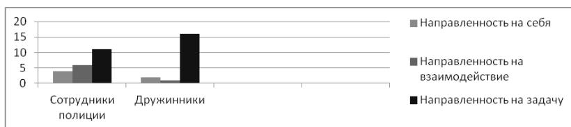
Диаграмма №3. Сопоставление результатов по методике «Тест определение направленности личности (ориентационная анкета Б.Басса)»

Анализ полученных результатов помог выявить следующее: у преобладающего числа респондентов тип личностной направленности – направленность на задачу, что доказывает их заинтересованность в решении профессиональных задач.