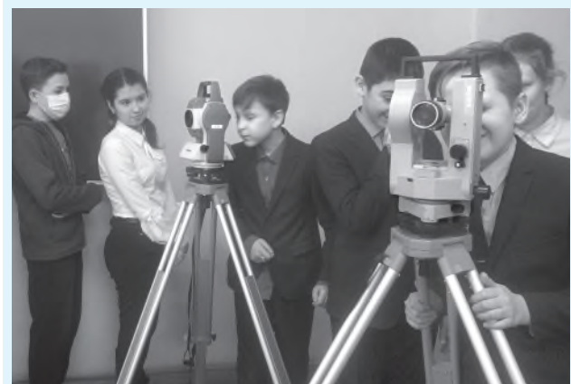
Школьники открыли для себя тахеометр марки Trimble M3 и теодолит ЗТ5КП