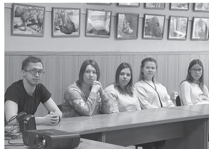
На факультете ветеринарной медицины и биотехнологии