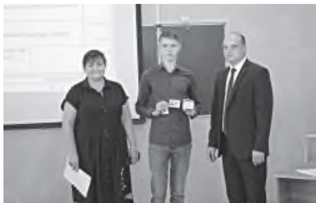
Вручение студенческих билетов на инженерном факультете

Я искренне желаю всем новых побед, фундаменталь-