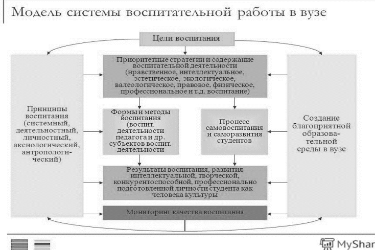
Рисунок 2 – Модель системы воспитательной работы в образовательной организации.