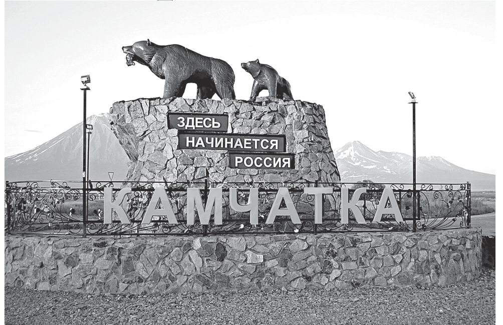
Скульптурная композиция «Медведи», более известная как памятник «Здесь начинается Россия», установлена неподалёку от международного аэропорта г. Елизово по пути в г. Петропавловск-Камчатский. Она является одной из наиболее популярных достопримечательностей региона и визитной карточкой Камчатки