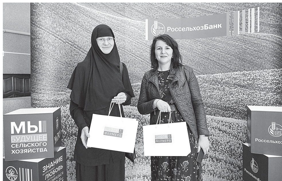
Среди студентов-фермеров немало женщин, которые уверены: будущее села в их руках

ляем свою продукцию по предварительным заявкам в Старой Майне, Чердаклах, Ульяновске. Почему мы пришли в «Школу фермера» на направление агротуризма? 2 года мы реализуем проект «Гости на ферме». Приглашаем людей посетить нашу ферму и показываем им то, что видим сами: удивительный мир животных, наши местные красоты, а места у нас действительно очень красивые. Люди приезжают, общаются с животными, глядят, кормят их, а мы рассказываем им много интересных историй из жизни животных на ферме и угощаем натуральной продукцией своей разработки. Потом проводим небольшую экскурсию