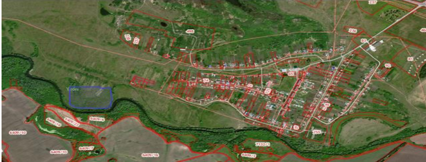
Рис. 1 – Схема расположения земельного участка

от 12.02.2021 г. № 9. была утверждена схемарасположения земельного участка на КПП в кадастровом квартале 73:10:031504, площадью 55492 кв. м (Рис. 1).