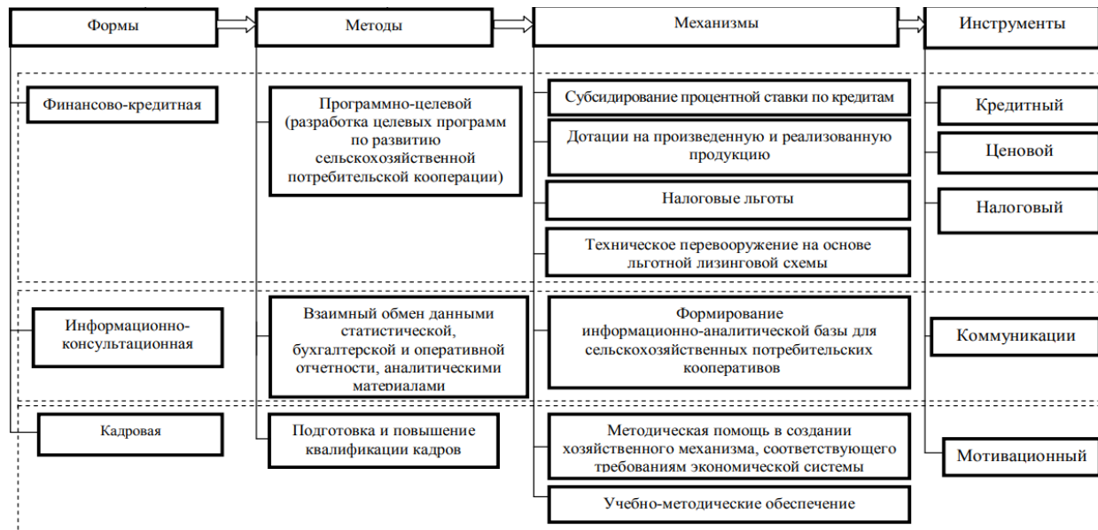
Рис. 3. —Методы, формы, механизмы и инструменты государственной поддержки сельскохозяйственной потребительской кооперации