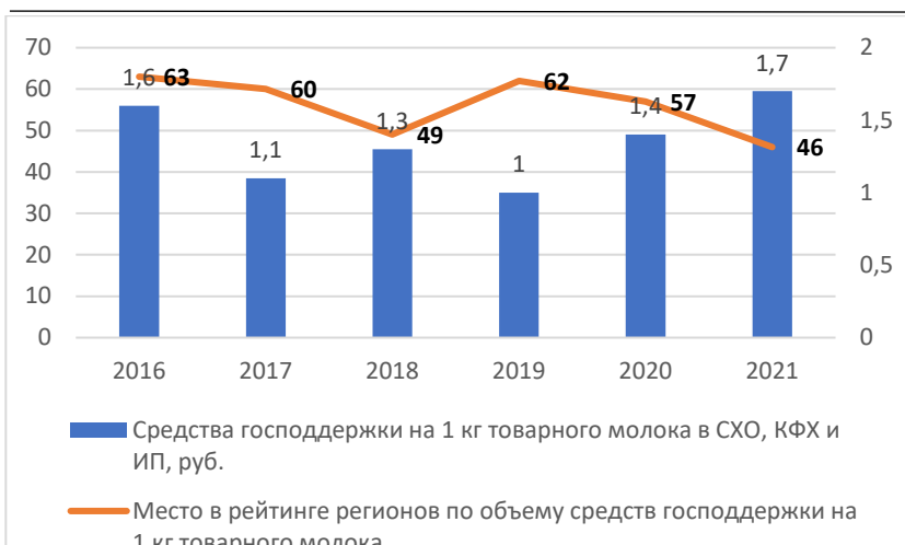
Рис. 1. – Динамика объема средств господдержки и места в рейтинге регионов по объему средств господдержки на 1 кг товарного молока

Стоит отдельно подчеркнуть, что финансовая поддержка молочного подкомплекса Ульяновской области выражалась в нескольких видах: