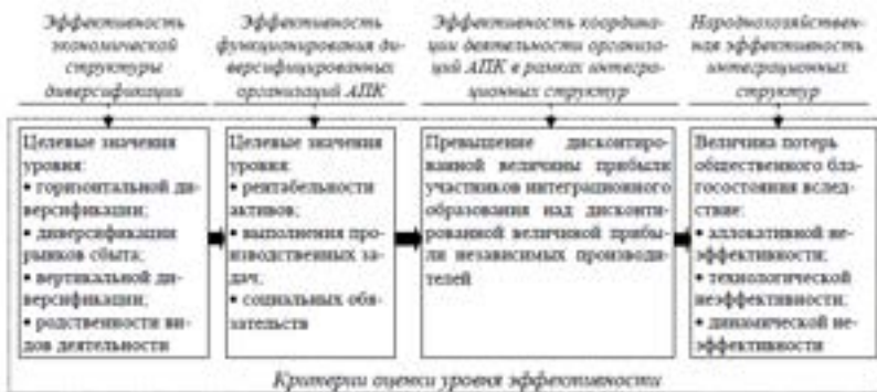
Рисунок 1 - Взаимосвязь форм и критерии эффективности диверсифицированных организаций АПК

уровень диверсификации. Максимальное значение коэффициента энтропии достигается при равномерном распределении производственной деятельности по отраслям, когда доли всех секторов аграрной экономики равны. Минимальное значение коэффициента, равное 0 достигается в случае максимальной специализации, когда вся деятельность сосредоточена в одном секторе [5, с. 22].