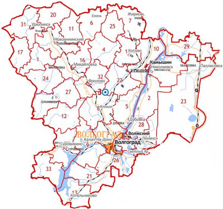
Рисунок 1 – Пример публичной кадастровой карты Волгоградской области

По клику на участок карты Волгоградской области можно узнать кадастровый номер объекта, площадь, назначение, год постройки (для дома) и можете перейти к просмотру всех доступных электронных отчетов.