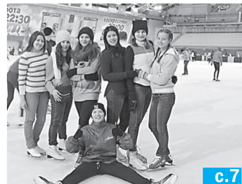
ФЕСТИВАЛЬ национальных культур