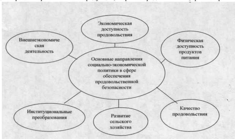
Рис. 1. Основные направления социально-экономической политики в сфере обеспечения продовольственной безопасности.

Государственное регулирование агропромышленного комплекса должно осуществляться по следующим основным направлениям: формирование и функционирование рынка сельхозпродукции, сырья и продовольствия; финансирование,