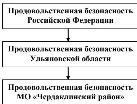
Рис. 1. - Место продовольственной безопасности муниципального района в системе продовольственной безопасности страны и региона

Согласно Доктрине продовольственной безопасности РФ под продовольственной безопасностью муниципального образования, мы будем понимать такое состояние экономики муниципального образования, при котором обеспечивается физическая и экономическая доступность для населения пищевых продуктов, соответствующих требованиям технических регламентов, в объемах не ниже рациональных норм потребления, необходимых для активного, здорового образа жизни. Обращаем ваше внимание на то, что мы сознательно опустили в своем определении понятие продовольственной независимости, так как считаем, что на уровне района она не может существовать. Это объясняется тем, что категория продовольственной безопасности муниципального образования имеет подчиненный характер по отношению к продовольственной безопасности страны и региона, в состав которого входит муниципальный район.