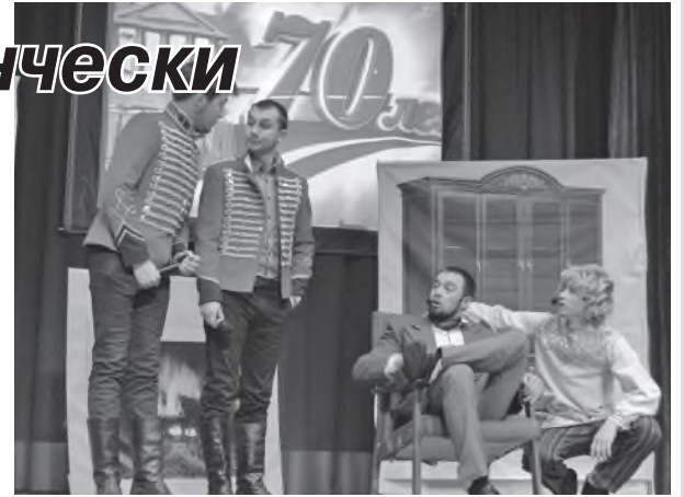
Команда экономфака была неподражаема