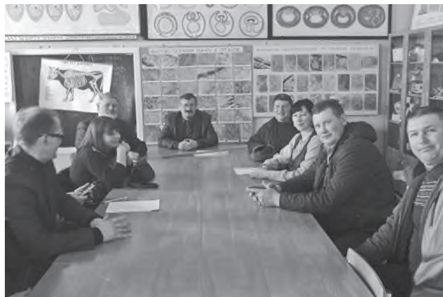
На родном факультете спустя 20 лет

Затем декан показал гостям новый стадион, памятник Петру Столыпину и учебно-административный корпус, а в нем – музей истории вуза. Затем участники встречи побывали в родном общежитии, где когда-то жили. Впечатленные увиденным в общежитии агрофака, многие из них заметили, что о подобном ремонте и совре-