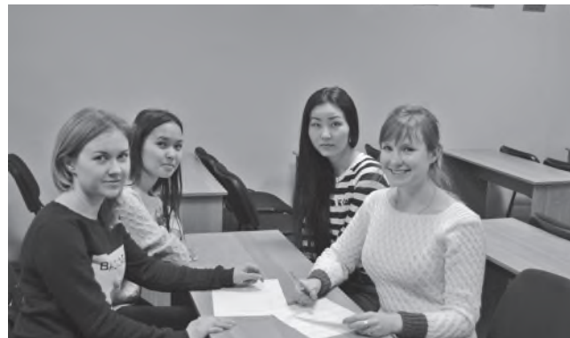
Российско-казахстанская команда «ЗКАТУ»

мерно две трети ЕГО составляло сырье для гидролизного и других видов производств. Ответьте, что ЭТО?».