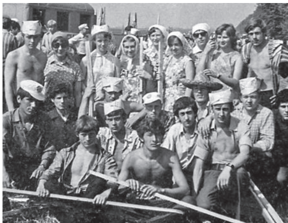
На областных соревнованиях трактористов