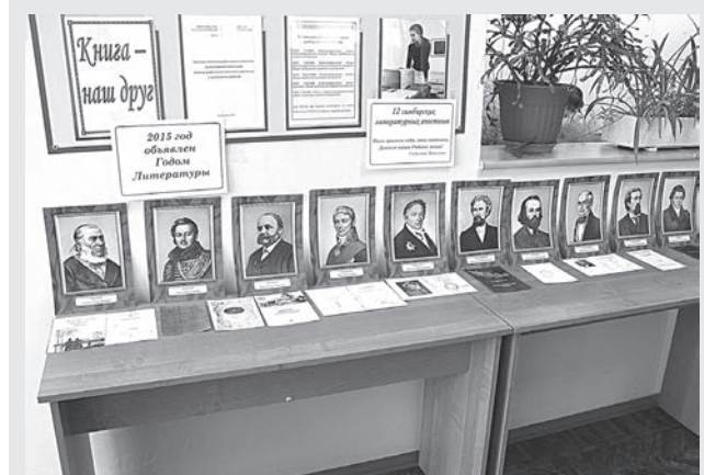
В читальном зале академии организована выставка «12 симбирских литературных апостолов»