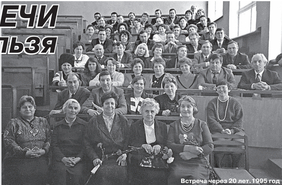
Встреча через 20 лет. 1995 год

Отличительная особенность выпуска – регулярные встречи сокурсников через каждые 5 лет, что еще больше сближало их друг с другом, духовно поддерживало и давало каждому дополнительную жизненную энергию, а часто и товарищескую поддержку по работе. Эти встречи всегда проходят на родном факультете, на каждую из них съезжаются однокурсники из различных регионов страны, стало доброй традицией прибывать на нее вместе с мужьями-женами, а позднее – с детьми.