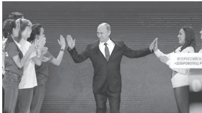
Президент Владимир Путин – яркий лидер страны

Хочу поздравить с наступающим Новым 2018 годом