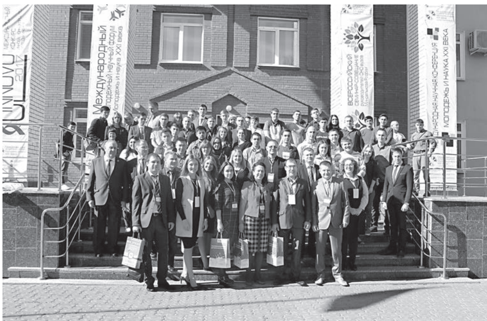
Для участников Международного научного форума «Молодежь и наука XXI века» он стал одним из значимых событий года

ске. Я раскрыла в себе новые способности, ведь проигрывать ситуацию один на один с оппонентом на большой публике требует большой стрессоустойчивости, харизмы и рассудительности. Долго размышляла над тем, кто до-