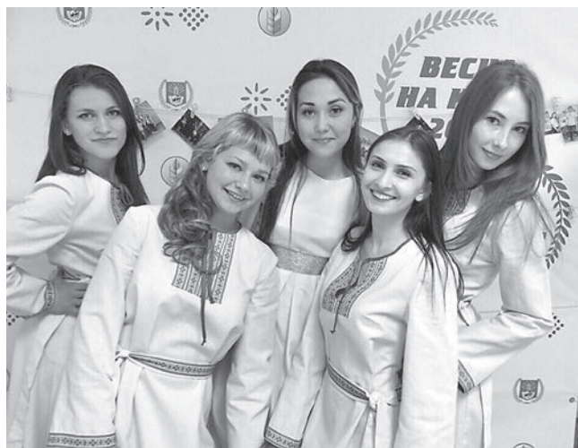
Участницы вокальной студии «Академия» блистали в этом году на многих подиумах, в том числе на Всероссийском студенческом фестивале «Весна на Каме»

– Главным событием этого года для меня стала возможность побывать в роли организатора Парада Победы на Красной площади. Именно там я получила заряд положительных эмоций на весь год. Еще одно событие, которое останется в моей памяти на всю жизнь, – победа в региональном отборочном туре «Управленческие поединки». Благодаря этому достижению я приняла участие в интеллектуальной студенческой олимпиаде «IQ ПФО» в г. Саран-