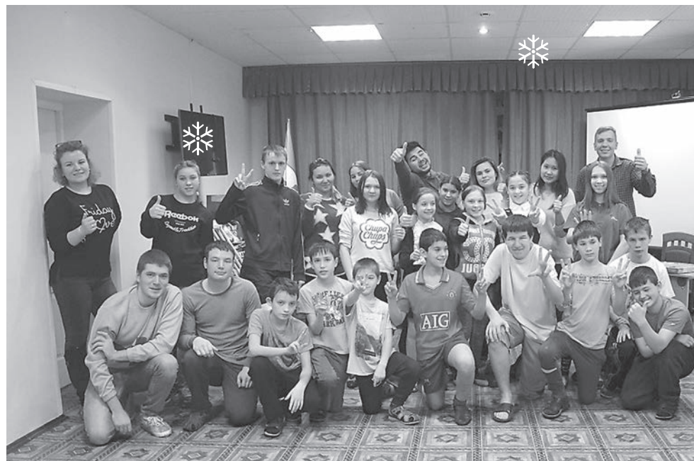
Каждый приезд волонтеров университета в детский дом – это большая радость для детей

Также хотелось бы поздравить с днем рождения не менее родного для меня человека. (Хотелось бы не называть её по возможности.)