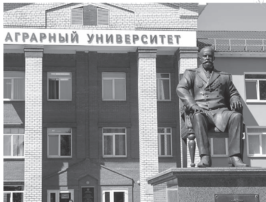
Получение вузом статуса университета – это предмет особой радости и гордости!

— Событием года вузовского уровня, по моему мнению, является полу-