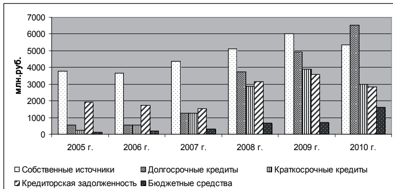
Рис.3. Источники финансирования сельскохозяйственных организаций Ульяновской области

Общая сумма источников финансовых ресурсов сельскохозяйственных организаций области равномерно возрастает, что можно отметить как положительное явление, однако доля собственного капитала в структуре источников финансовых ресурсов ежегодно снижается (рис. 3). Если в 2006 г. она составляла 55,6 %, то к концу 2010 г. составила 30,1% от общей величины источников.