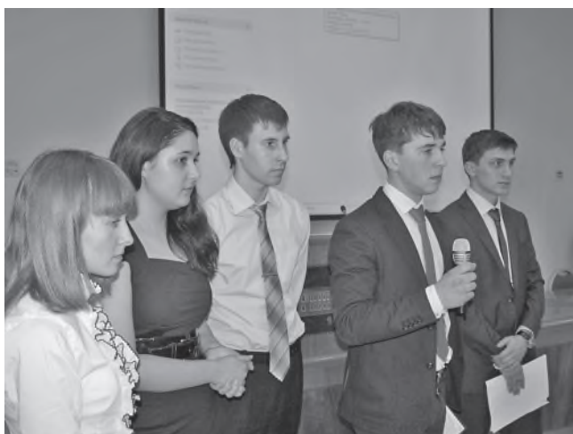
Лучшие фотоработы А. Бuryкина