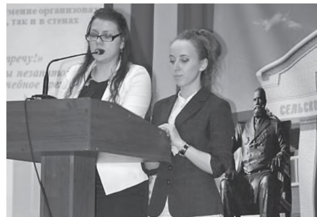
Студентки ветфака представили проект «Шаг навстречу!»

ним на одном языке. Поддача информации студентами сможет убедить и заинтересовать школьников. Именно студент сможет рассказать об академической жизни, о мероприятиях и интересном проведении досуга.