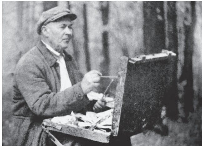
А.А. Пластов на этюдах. Сентябрь 1963 г.

Научно-исследовательская работа ученого посвящена преимущественно болезням молодняка. С.Н. Чевским написаны и изданы две книги, еще четыре выпущены в соавторстве, опубликованы 2 брошюры, 42 статьи, 523 фотографии по патологии животных (61 из них в 15 изданиях различных авторов). Под научным руководством ученого защитили кандидатские диссертации И.Н. Докторов и А.С. Горбунов, многие годы работавшие в нашем вузе.