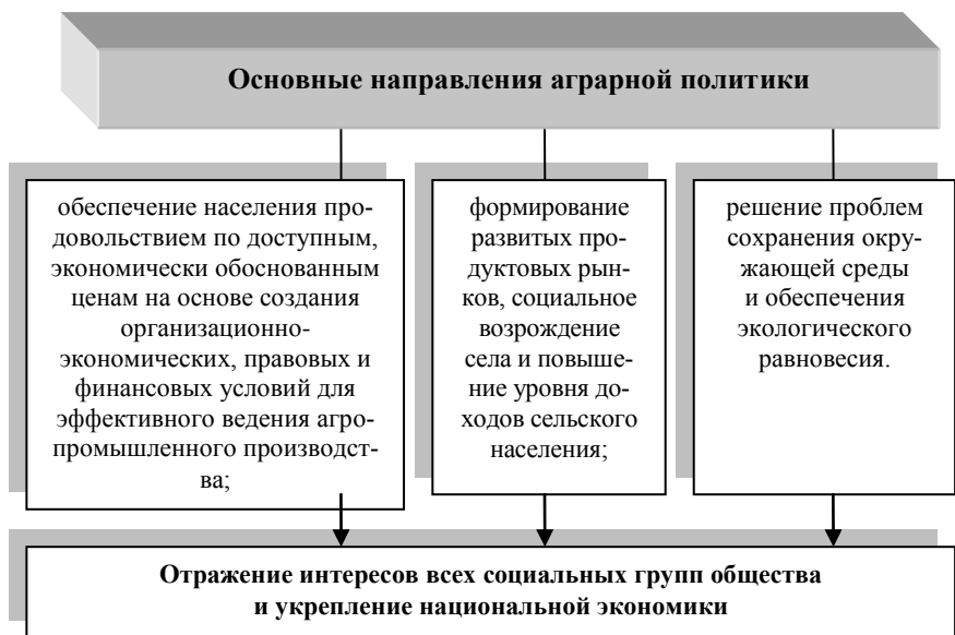
Рисунок 1 - Целевая направленность аграрной политики

Применение целевого принципа при разработке региональной аграрной политики состоит в выборе приоритетов, которые могут быть направлены на поддержку производителей или потребителей. В число приоритетов аграрной политики объективно входят: во-первых, меры по обеспечению доходности товаропроизводителей агропромышленного комплекса через оказание им государственной поддержки, созданию условий для снижения издержек производства и улучшению инвестиционного климата в аграрном секторе экономики страны; во-вторых, государственное содействие развитию инфраструктуры продовольственного рынка, разумный протекционизм.