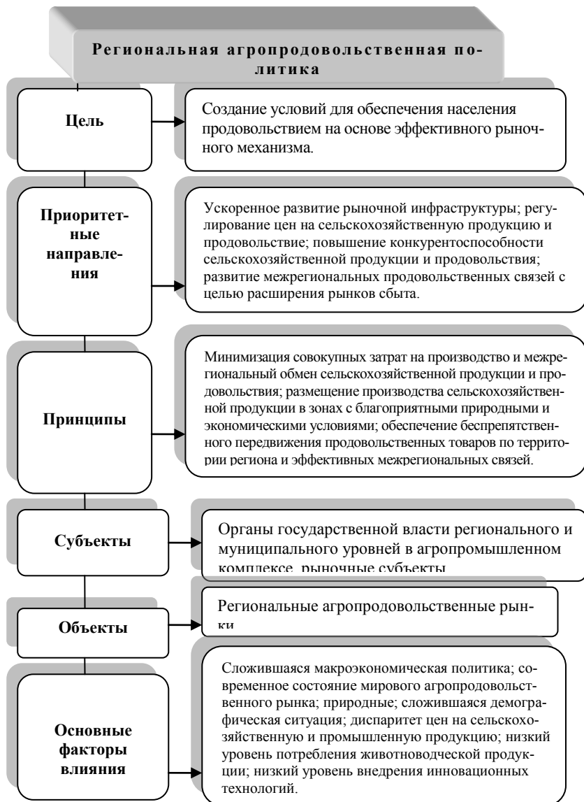
Рисунок 3 - Основы современной региональной агропродовольственной политики