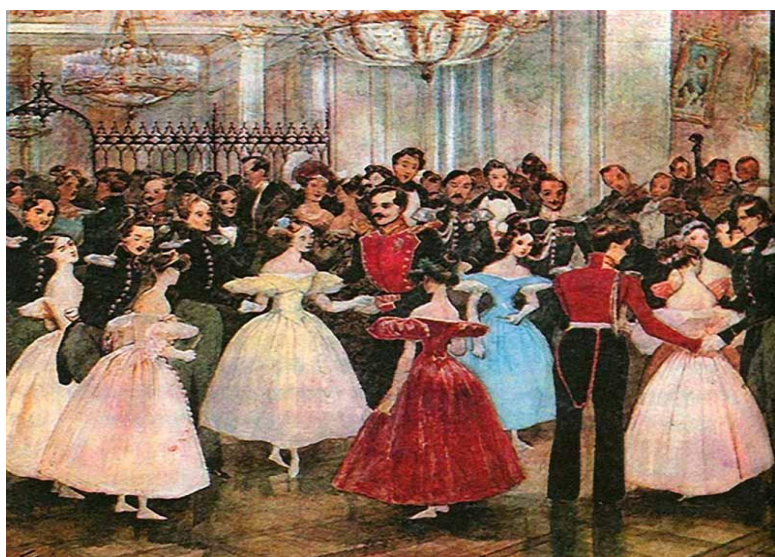
«Бал у княгини М.Ф. Барятинской», 1830-е гг [2]

Таким образом, мы видим, что балы и званые ужины были неотъемлемой частью жизни русского дворянства. Это время интриг и просто беззаботной болтовни. Балы были поводом показать себя, весело и шумно провести ночь [2].