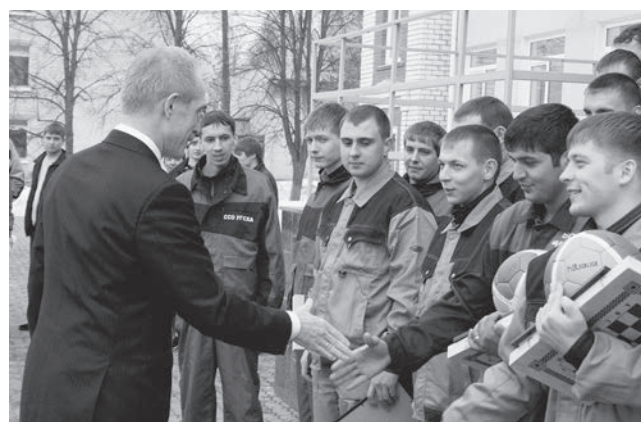
Встретился 13 апреля с бойцами студотрядов и губернатор С. Морозов