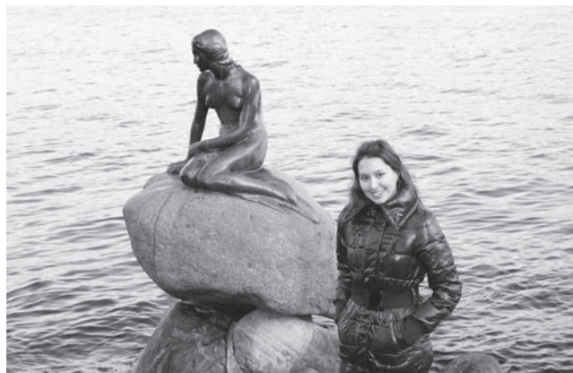
Памятник Русалочке – символ Копенгагена