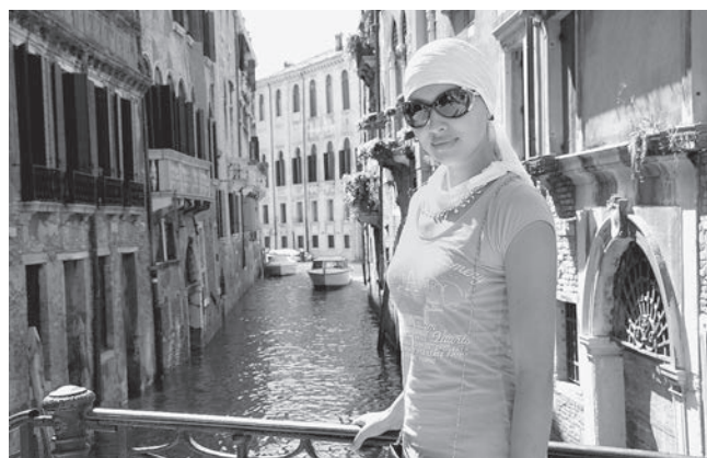
Венеция – красивейший уголок планеты