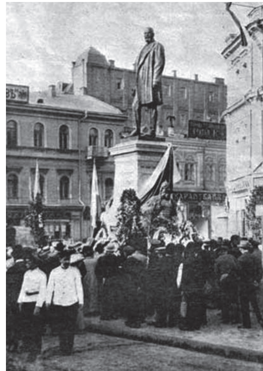
Памятник П.А. Столыпину в Киеве, построенный в 1913 году. Бюст симбирского памятника был точной копией киевского

Ю. Козлова «Столыпин и Симбирск» («Ульяновская правда», 15 сентября 1990 г.)