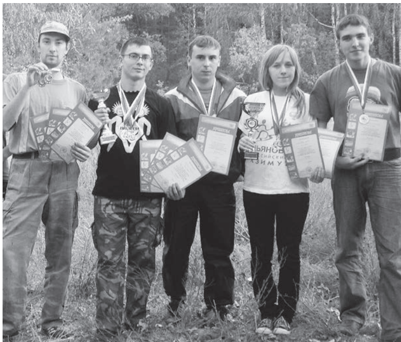
Трофеи команды УГСХА