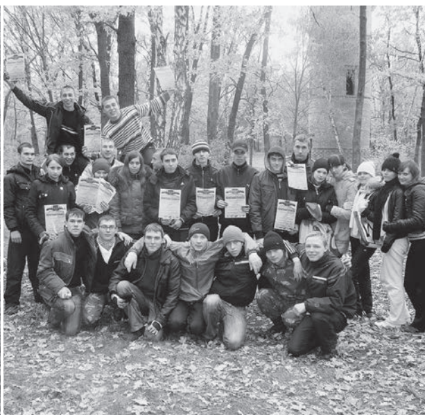
С наградами и отличным настроением