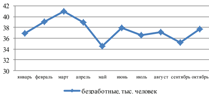
Рисунок 1 – Динамика безработицы в Ульяновской области

Уровень безработицы в Ульяновской области выше, чем по стране. В октябре 2013 года численность безработных граждан составила 4,1 млн. человек по стране и 3556 человек по Ульяновской области [4].