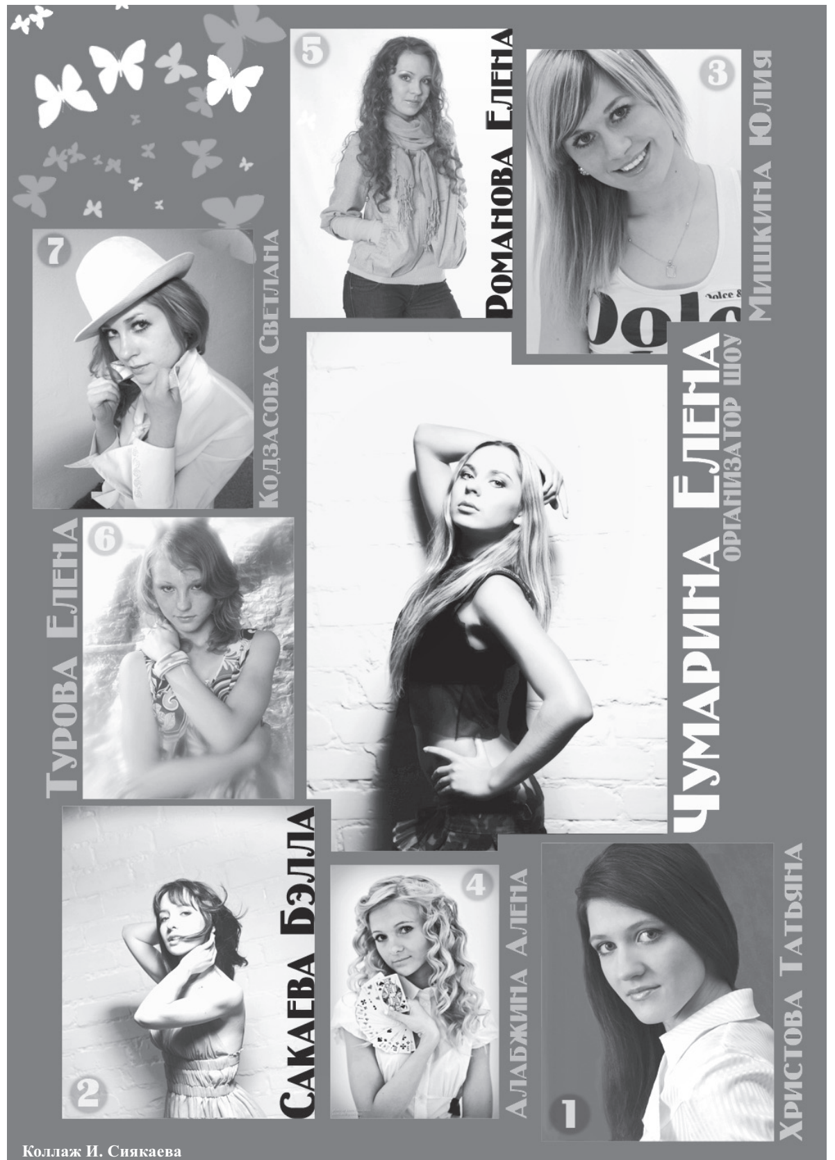
Коллаж И. Снякаева

- Я веселая, целеустремленная, жизнерадостная, решительная и эмоциональная. Оптимистично смотрю на жизнь и смело иду навстречу новым впечатлениям! Люблю танцы, торт со взбитыми сливками, путешествия, туфли на высоком каблуке, собак и дорогие авто, стремлюсь к гармонии души и тела. Не выношу завистников, скряг и лицемеров. Занимаюсь в модельном агентстве S'Lana. Мой девиз по жизни: меняй мир