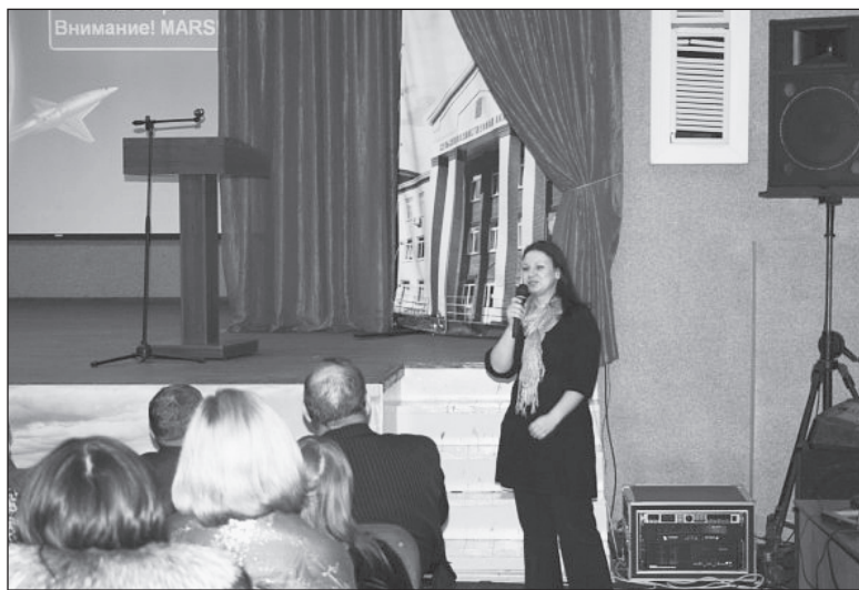
Свои требования представители компаний озвучили на ярмарке вакансий

фективность профессиональной деятельности специалиста оказывают: практические знания, умения и способность работать в коллективе, команде - этот фактор подчеркнули 80% респондентов; профессиональная общетеоретическая подготовка - 76%; уровень базовых знаний, умений и готовность к дальнейшему обучению - 64%; навыки работы на компьютере, знание необходимых программ - 56%; способность воспринимать и анализировать новую информацию, развивать новые идеи - 48%; умение представлять себя и результаты своего труда, эрудированность, общая культура и осведомленность в смежных областях полученной специальности - 40%; нацеленность на карьерный рост, профессиональное развитие и навыки управления персоналом - 32%. Примечательно, что в этом году по сравнению с 2009-м в два раза больше работодателей указало на необходимость владения иностранным языком.