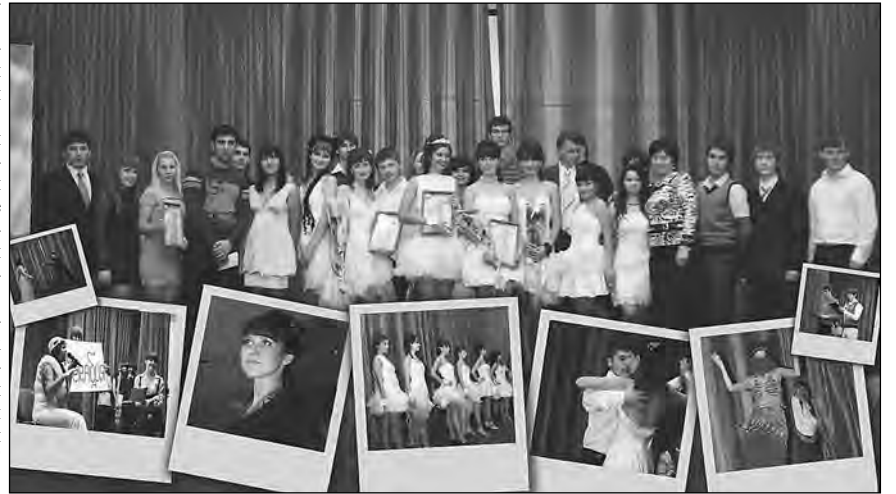
Коллаж И. Сиякаева

К празднику причастна еще одна красивая и талантливая студентка ака-