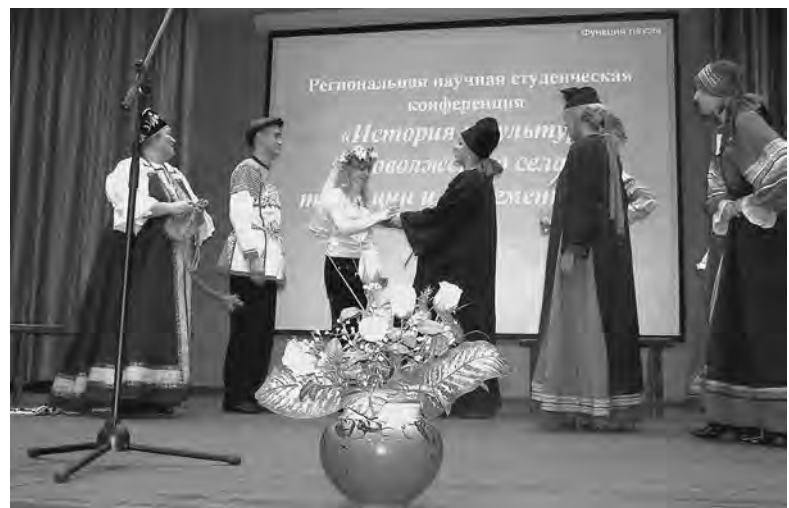
Обряд сватовства в исполнении ансамбля «Веретено» и студентов

Наш корр. Продолжение темы читайте в следующих номерах газеты.