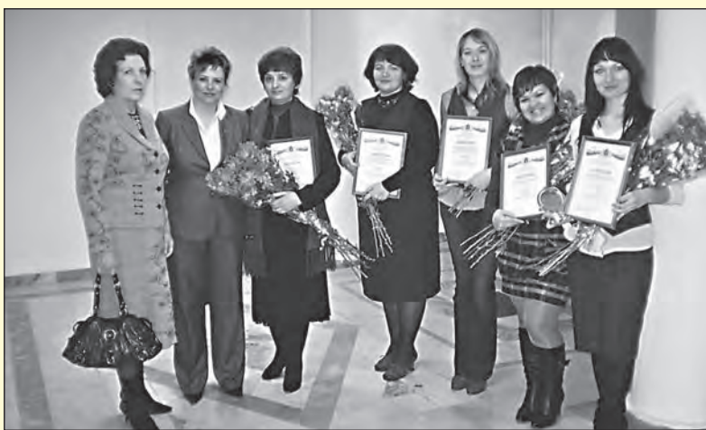
Их объединяет экономфак академии