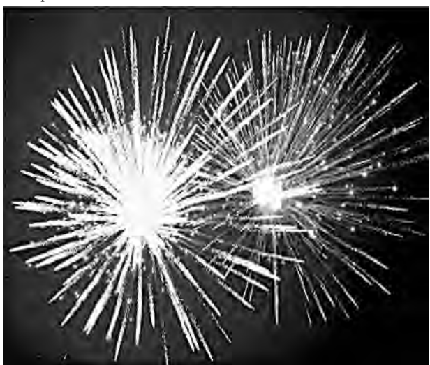
5 августа 1943 года в Москве прогремел первый салют