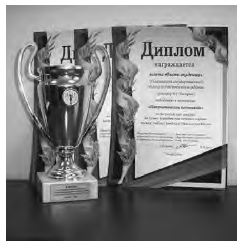
Кубок и дипломы газеты «Вести академии» дополнили копилку вуза