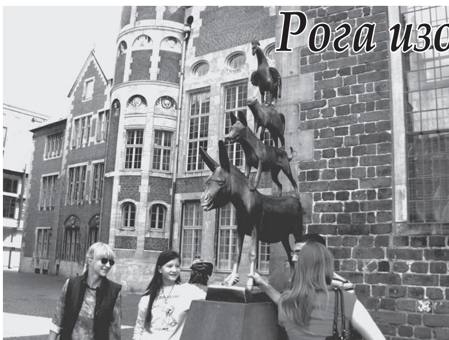
Возле «Бременских музыкантов» всегда много туристов

Как бывшая практикантка LOGO могу сказать, что эта стажировка даёт многое. Это и знакомство с экологическим земледелием, с культурой, традициями и устоями Германии, с новыми людьми, и возможность значительно улучшить свой языковой уровень, путешествовать по городам не только Германии, но и других стран Европы. А также это то время, когда вдалеке от родины и близких людей ты учишься самостоятельности, закаляешь свой характер.