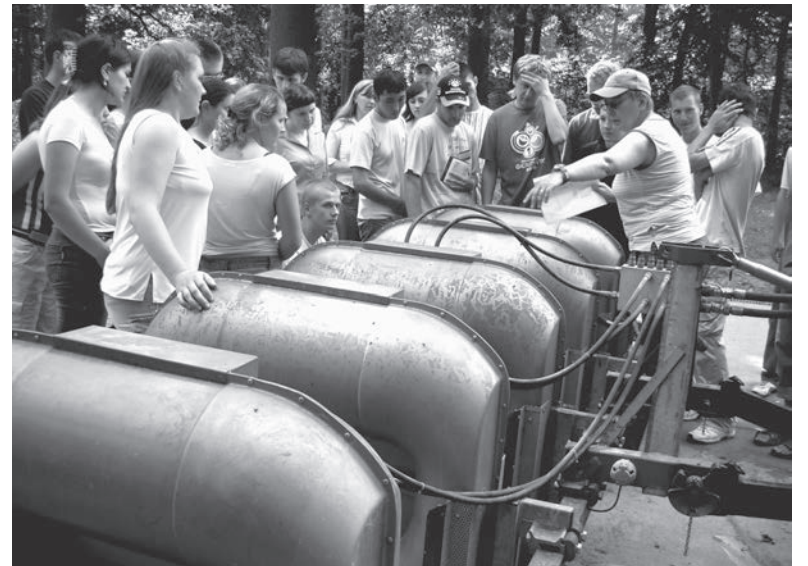
Стажеров знакомят с установками для получения биогаза

LOGO обязывает практикантов вести отчётную тетрадь. В ней отмечаются различные аспекты трудовой деятельности и записываются конкретные наблюдения и замечания о характере производственных процессов. Отчетная тетрадь ведется на двух языках – немецком и русском. По возвращении на родину эти тетради, которые контролируются фермерами и представителями LOGO, будут исчерпывающим источником информации для руководителей институтов о прохождении практики в Германии.