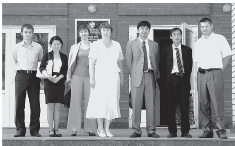
В июле 2008 года академию посетила делегация из Кореи