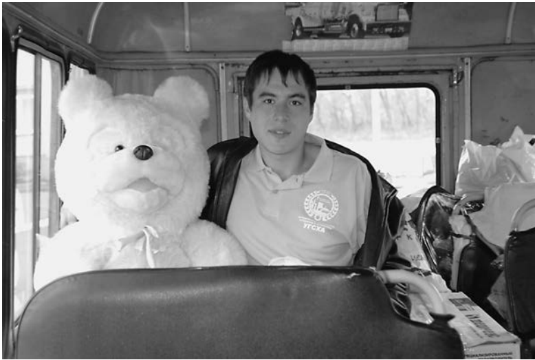
С игрушками - в интернат

В России на сегодняшний день для более чем 260 000 детей домом являются сиротские учреждения или приюты. Это 1500 детских домов, 240 домов ребенка, более 300 школ-интернатов, более 700 социальных приютов и 750 социально-реабилитационных центров для детей и подростков. Одним из них является Крестовогородищенская школа-интернат, в которой сейчас воспитывается более 80-ти сирот и детей, оставшихся без попечения родителей.