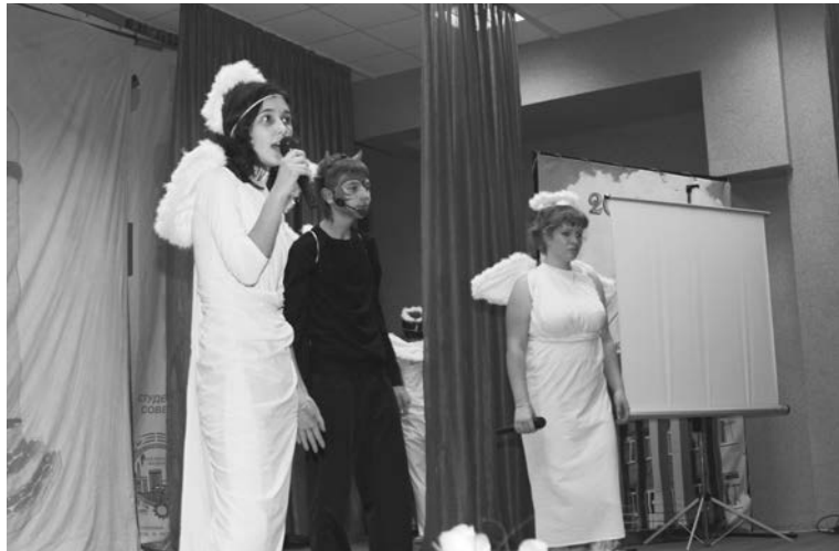
Крылатые «экономисты» взлетели на первое место