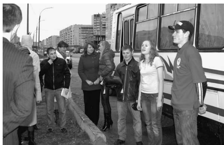
Пассажиры первого рейса встречали профкомовцы