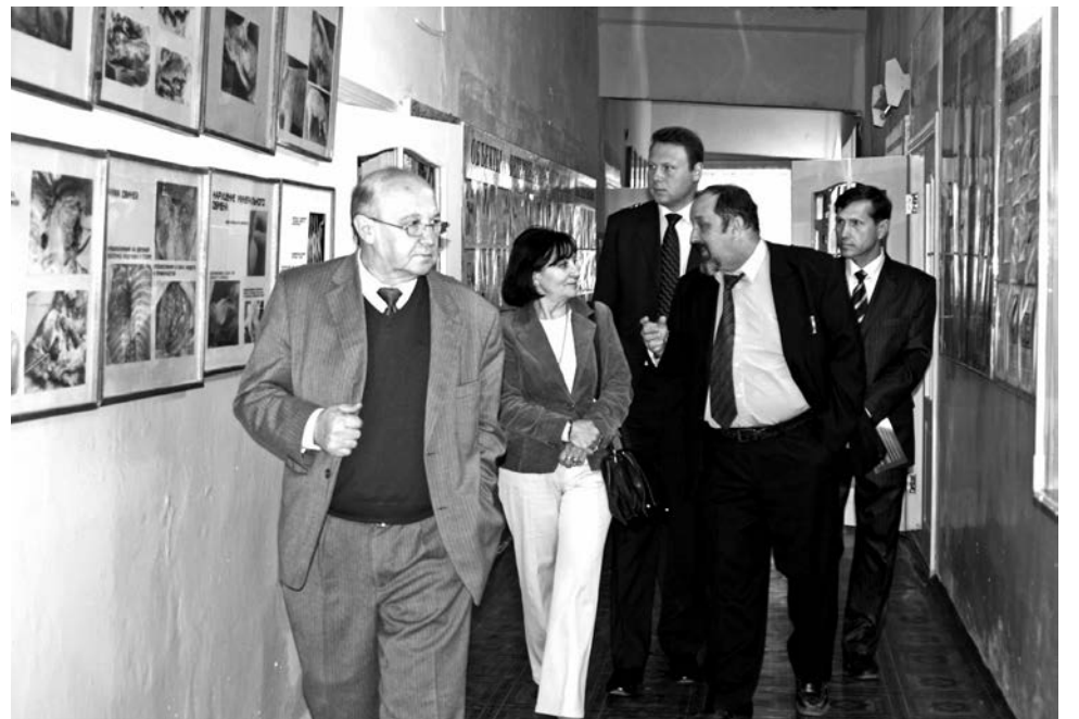
На кафедре микробиологии гостям было на что посмотреть