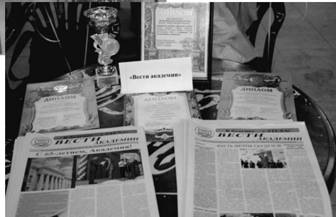
Презентация нашей газеты в «СМИшном городке»

дружеские отношения. «Мы не чувствуем себя конкурентами. «Мисс и Мистер Пресса» - наше общее дело, благодаря которому мы познакомились», - охотно рассказывали конкурсанты представителям прессы УлГТУ.