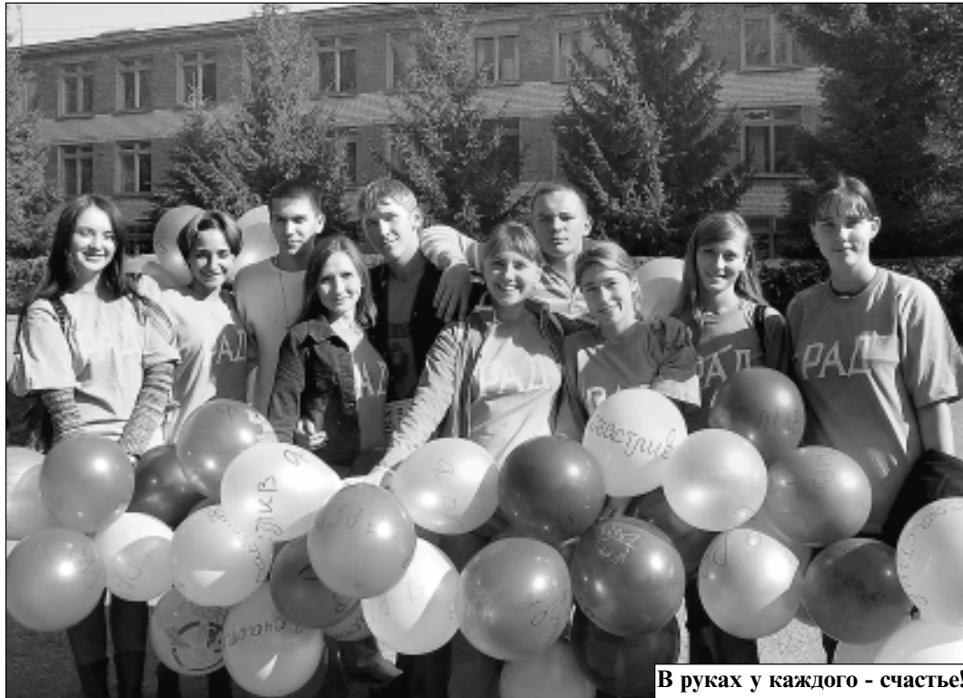
В руках у каждого - счастье!

чтобы их кто-нибудь ждал: родные, старший брат, друзья, близкие люди и... поклонники. Более целеустремленные стремятся к совершенству, добиваются своих целей и считают счастье своим смыслом