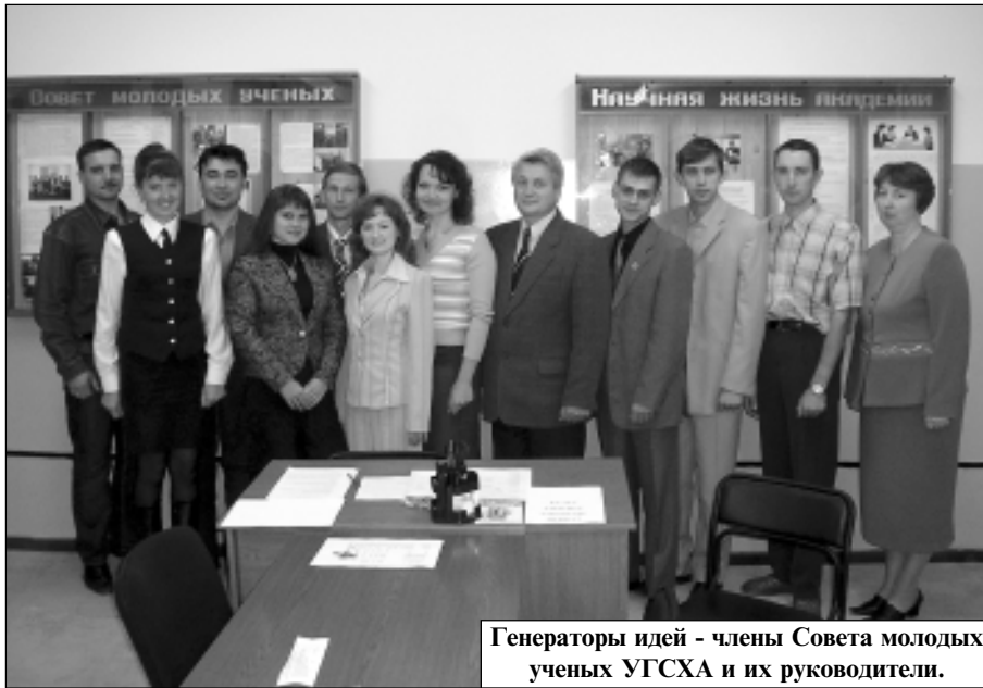
Генераторы идей - члены Совета молодых ученых УГСХА и их руководители.