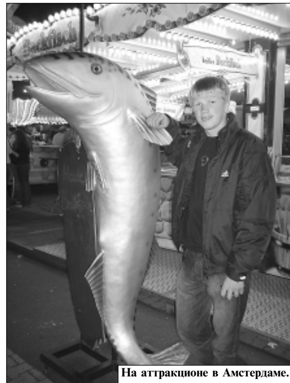
На аттракционе в Амстердаме.